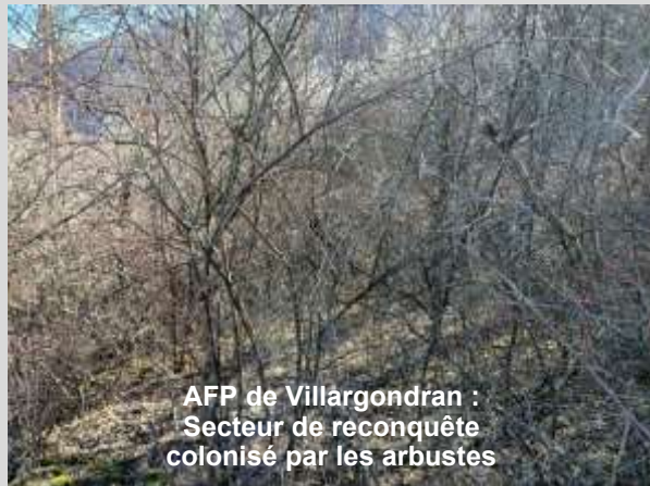
AFP de Villargondran : Secteur de reconquête colonisé par les arbustes