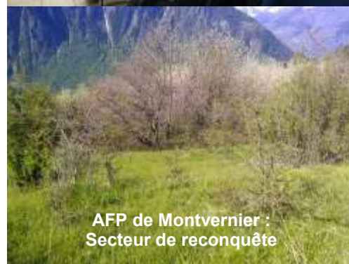
AFP de Montvernier : Secteur de reconquête