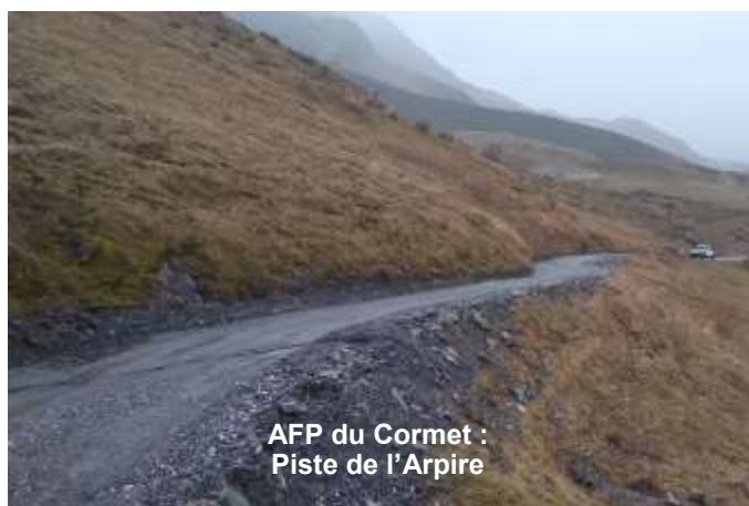
AFP du Cormet : Piste de l'Arpire

Des contrats de location ont été rédigés suite au diagnostic pastoral, porté par la CC Cœur de Savoie et réalisé avec l'appui de la SEA. De nouveaux membres sont impliqués dans l'AFP ce qui permet de relancer de nombreux sujets.