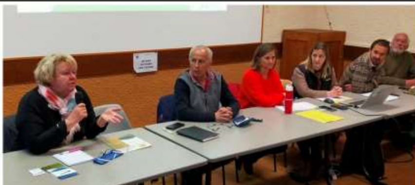
Réunion d'information à Saint Alban d'Hurtières

D'autres territoires s'interrogent sur la création d'une AFP sur leur territoire. La Chambre d'Agriculture et la DDT sont allées à la rencontre des communes des Allues, de Challes les Eaux ou encore de Valloire pour leur présenter l'outil. En fonction des besoins pressentis, la FDAFP est amenée à participer à ces premières rencontres.