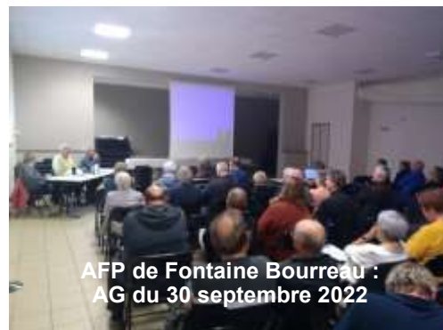
AFP de Fontaine Bourreau : AG du 30 septembre 2022

L'AFP a un projet de reconquête pastorale sur trois secteurs (sur 3,5 ha au total). Les travaux auront lieu au printemps 2023.